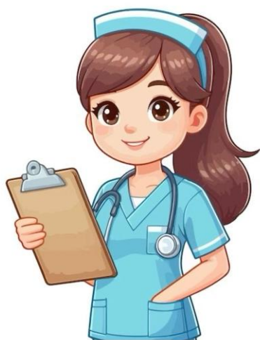
Obrázek 1 Popisek obrázku